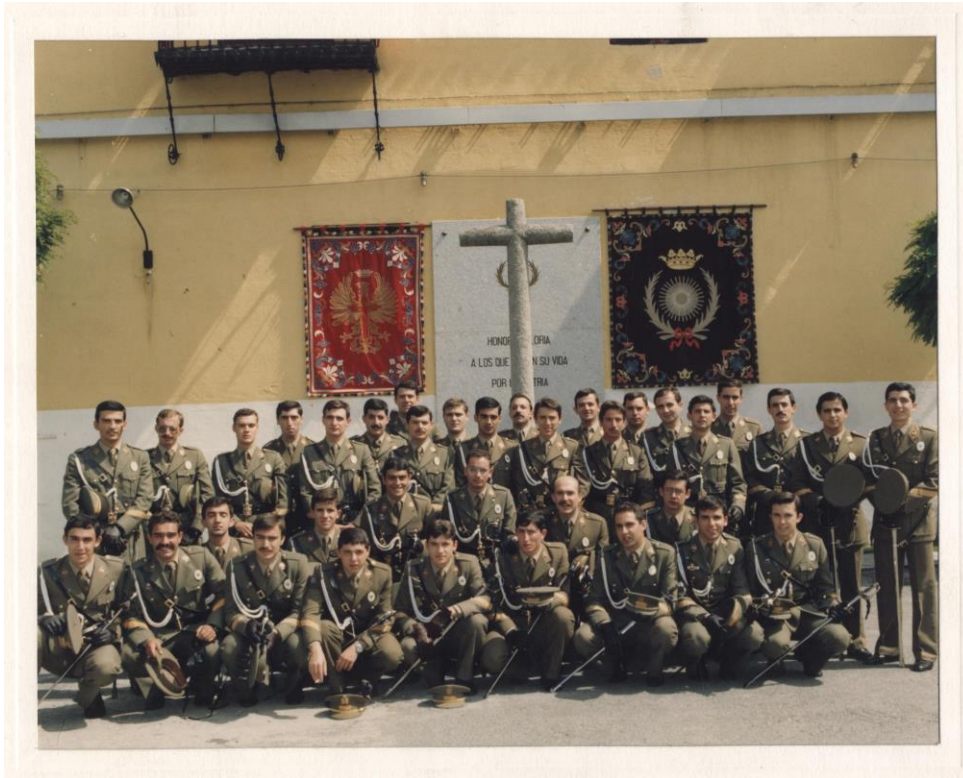
Sargentos Eventuales en Prácticas de la VII Promoción en la Academia de Intendencia

Desde el año 1977 que salió la I Promoción de Suboficiales de Intendencia de la Academia General Básica de Suboficiales y hasta el año 1994 que salió la XVIII han salido un total de 374 Sargentos -ver grafico-.