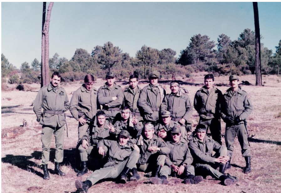
Alumnos de II año de la XI Promoción de Maniobras.

Dependiendo de Promociones unos hacían un Curso al acabar el segundo año u otros al acabar tercero. Este Curso solía ser de Auxiliar de Contabilidad o Vestuario y Equipo o ambos.